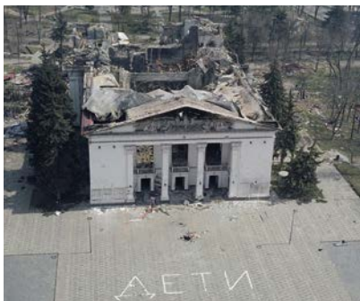
Marioupol, le théâtre détruit.

Cette vitalité créatrice sera au cœur des rencontres que nous organisons les 17 et 18 juillet, avec le concours de la Chartreuse de Villeneuve-lès-Avignon et de la Maison Jean Vilar.